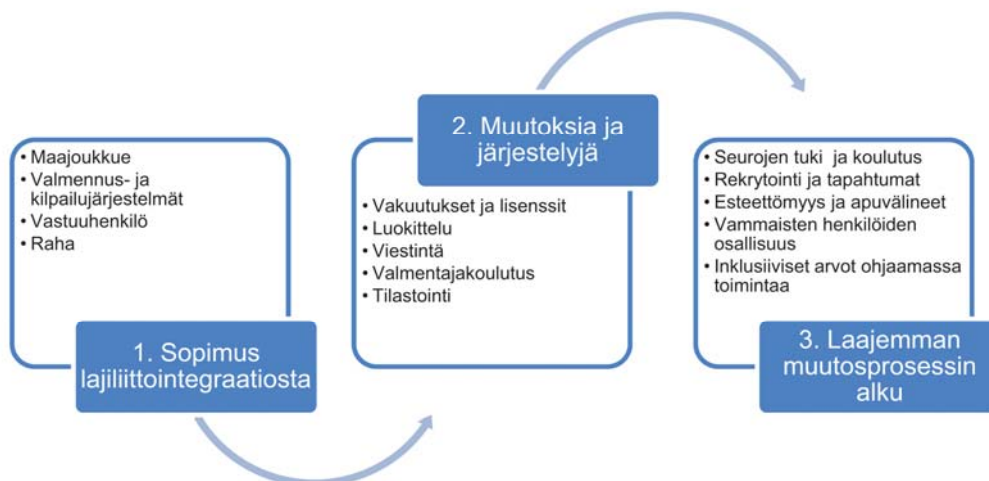
KUVIO 1 Integraation prosessien eteneminen lajiliitoissa.

Inklusio-otteella käynnistyneissä integraation prosesseissa (SLU:n alueet) päästiin nopeammin kiinni osallistumisen esteisiin ja muokkaamaan niitä, mutta niiden rajoitteena on, että prosessit rajoittuvat pääsääntöisesti vain lasten liikuntaan. Olen kuvannut tätä muutosprosessia kuviossa 2.